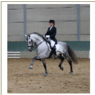
Gringo WH 6 jarige PRE hengst

daadwerkelijk wil proberen om binnen de Europese norm van 7 maanden te blijven bij het voorzien van paspoorten. Deze 7 maanden zijn echter in de praktijk erg kort, zeker gezien alle handelingen die verricht moeten worden voordat uw nieuwe veulen uiteindelijk een paspoort heeft. Denkt u hierbij aan de tijd die er staat voor bijvoorbeeld de verzendingen van de stukken, het laboratoriumwerk, de drukkerij, de dierenartsbezoeken voor het DNA materiaal, het nemen van de aftekeningen en het chippen van het veulen, de administratieve werkzaamheden van het stamboek, etc. Zaak dus om als veuleneigenaar adequaat te reageren, u plukt er immers zelf de vruchten van wanneer u uw paspoort op tijd binnen heeft!